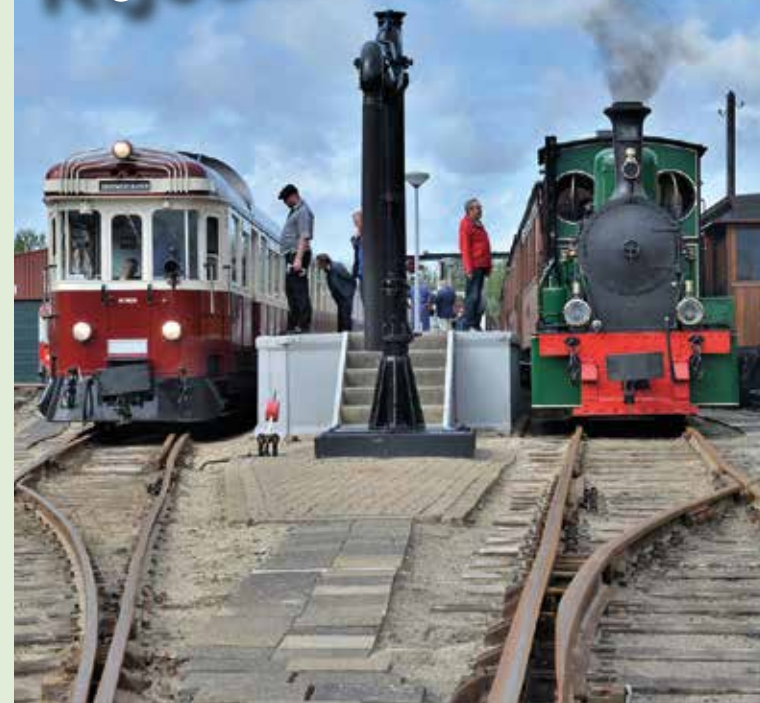
V.H. ROTTERDAMSCH TRAMWEG MAATSCHAPPIJ

Het RTM-museum aan de Brouwersdam in Ouddorp nodigt u uit voor een nostalgische rit door de duinen en over de Brouwersdam in het authentieke trammaterieel van de RTM. Bezoek ons uitgebreid en vernieuwd museum!